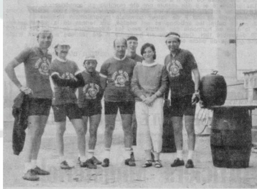
Halte dégustation au pays de l'Armagnac

Les cyclos de Longny et de Mortagne à la semaine fédérale