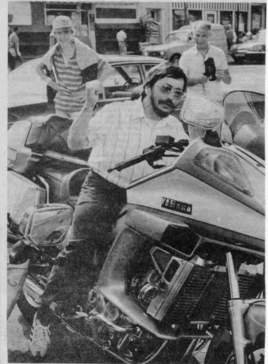
Les grosses cylindrées ne font pas peur à Petit Jean