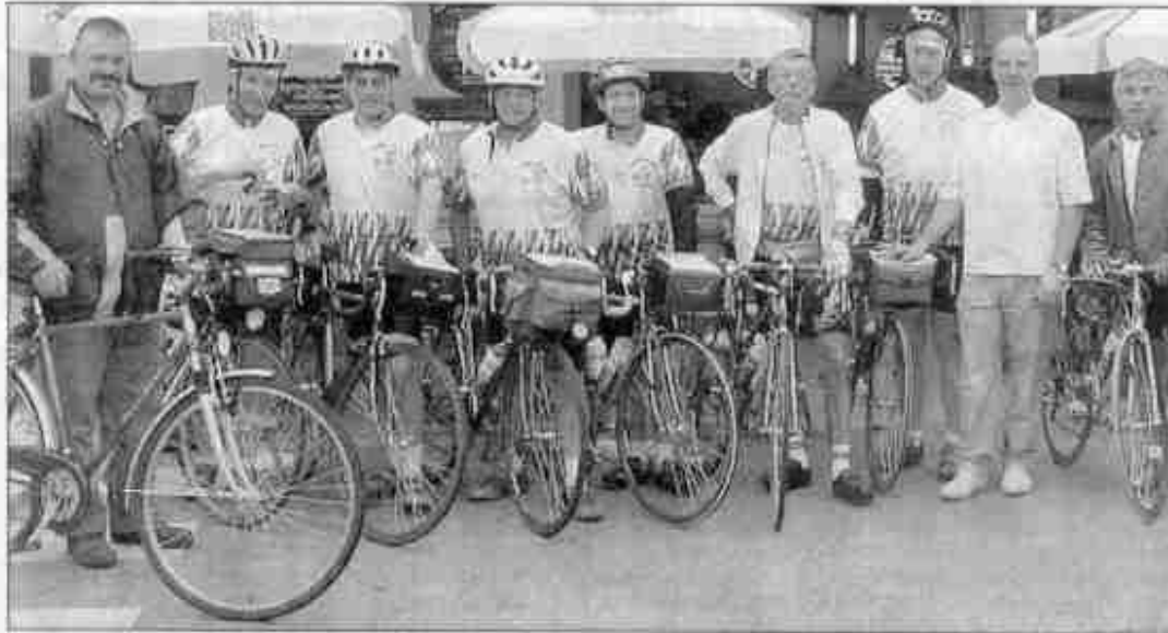
Samedi matin, le groupe au départ pour 300 km en deux jours.