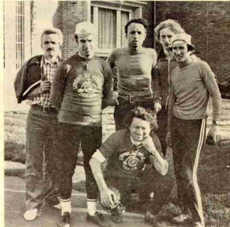
L'enfer du Nord pour les cyclotouristes